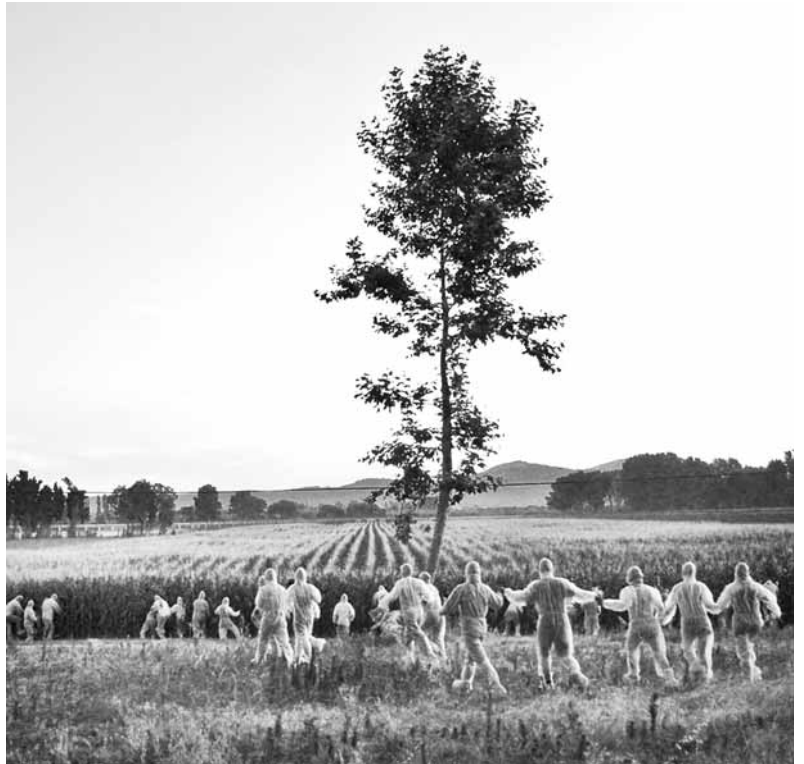
El 12 del juliol passat es van sabotejar dos camps de blat de moro transgènic de l'empresa Syngenta

En primer lloc, cal treballar de valent per garantir la viabilitat de les experiències transformadores que s'han endegat durant la darrera dècada. En segon lloc, cal seguir acumulant forces, teixir més aliances cada cop més àmplies i cuidar les que ja s'han creat per fer-les més sòlides. En tercer lloc, és necessari continuar esmolant les reflexions, les maneres de fer i les propostes. Tot això, si es vol avançar cap a un horitzó en què les pràctiques i les idees que caracteritzen el moviment siguin assumides (després d'haver estat pertinentment esmenades) per una massa social crítica capaç d'impulsar a la pràctica les transformacions estructurals des de l'arrel, a les quals —de moment— tan sols s'aspira.